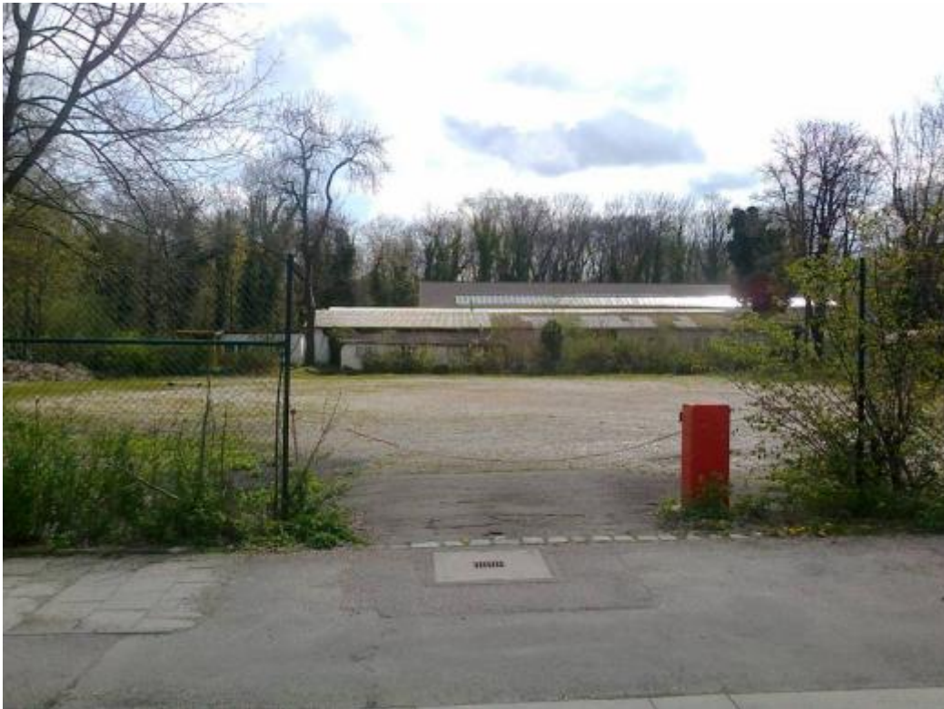
Parkplatz bei der Osterwaldstr. 18