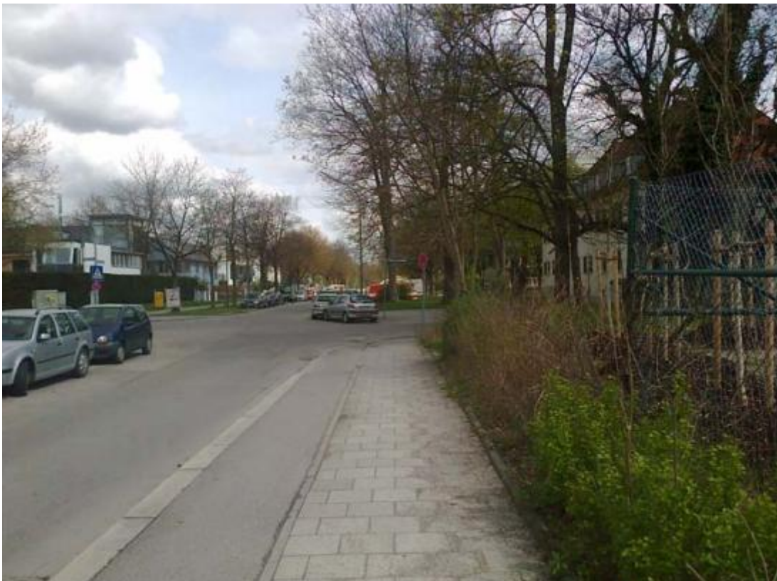
Vom Parkplatz dann rechts in die Mommsenstrasse zur Startnummern Ausgabe (ca. 8 min)